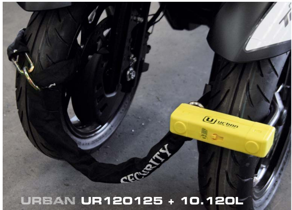
URBAN UR120125 + 10.120L